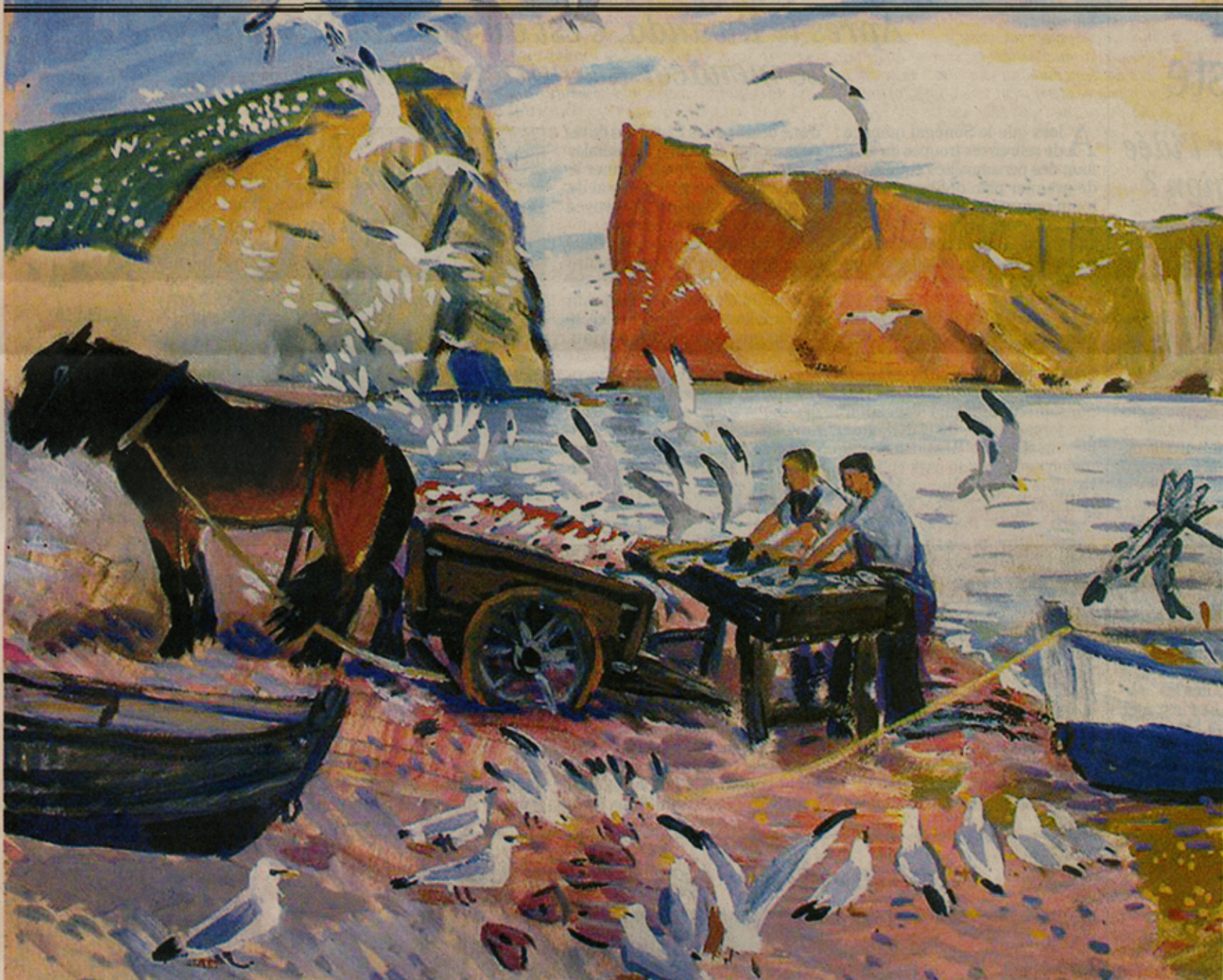
Déchargement de morue, Percé, Québec. Étude à la gouache, 1950.